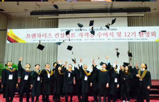
프랜차이즈 컨설턴트 자격증 수여식 Franchise Consultant Certificate Awarding Ceremo