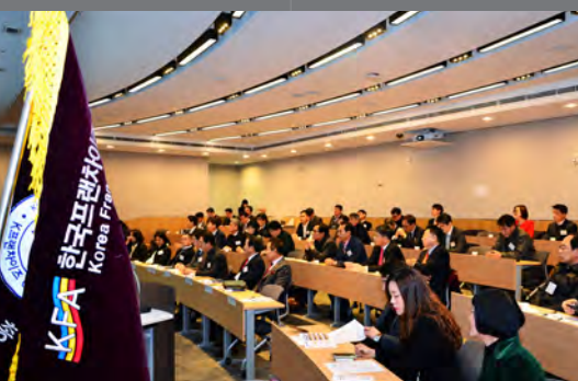
6기 KFCEO 입학식 KFCEO 6th Entrance Ceremony

We are always diligently promoting various projects for the advancement and development of the franchise industry while also striving to be socially responsible.