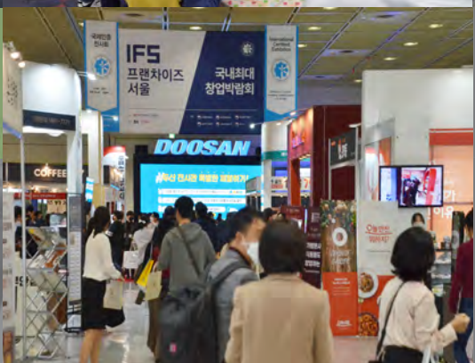
제52회 IFS프랜차이즈서울 박람회 2022 52nd International Franchise Show Expo