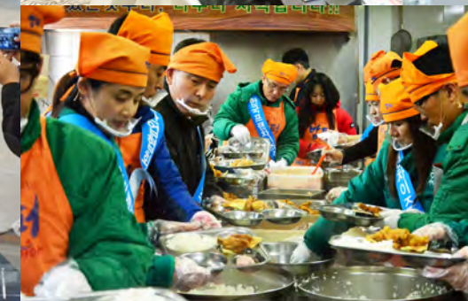
사회봉사활동(사랑의 밥퍼) CSR Activities(Lovely Meal Server)