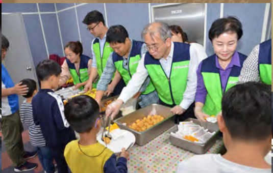
사회봉사활동 성동보육원 CSR Activities Seongdong Orphanage