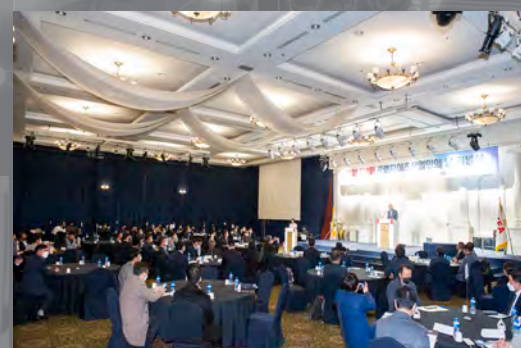
2021 제4회 프랜차이즈 산업인의 날 기념식 2021 4th Franchise Industry Day