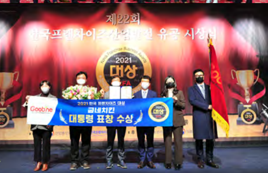
2021 제22회 프랜차이즈대상 2021 22th Korea Franchise Business Award