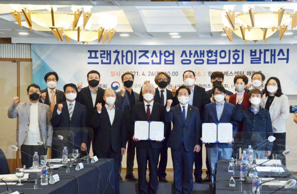
산업부 장관 프랜차이즈산업 상생협의회 발대식 Launching Ceremony of Franchise Industry Corporate Partnership Council with the Minister of MOTIE