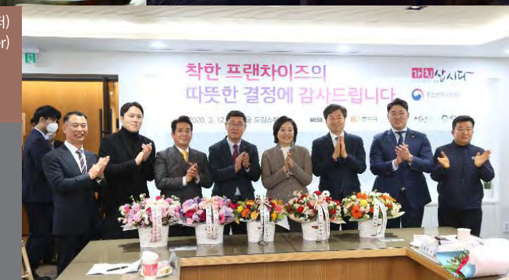
코로나19 극복 위한 <착한 프랜차이즈 캠페인> <Good Franchise Campaign> to overcome with COVID-19